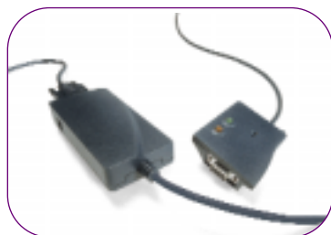
Option directPrint pour mimio Windows® ou mimio Mac

Augmentez les fonctionnalités de mimio en y ajoutant matériel ou plug-ins. Dans un bureau, une salle de formation ou une salle de conférence, mimio peut vous aider à gagner du temps et améliorer votre productivité.