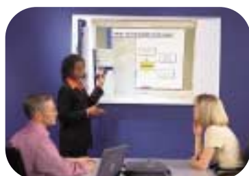
Application mimioMouse pour mimio Windows® et mimio flipChart

application standard avec les produits mimio