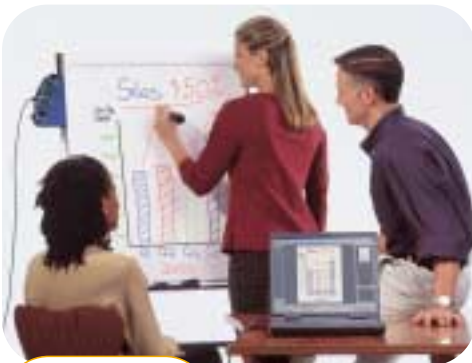
Tableau papier relié à mimio flipChart Windows®