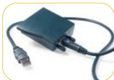
Option adaptateur USB pour mimio Windows®