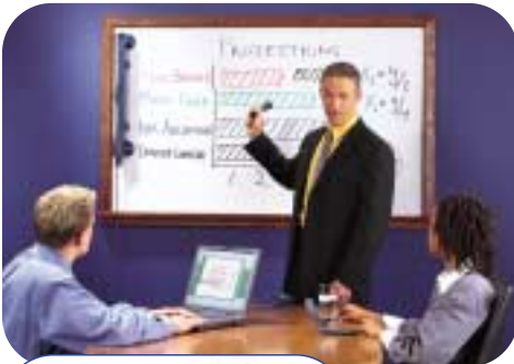
Tableau blanc relié à mimio Windows® ou mimio Mac

Si vous utilisez un tableau blanc ou un tableau papier, un PC ou un Mac, et dirigez, apprenez, concevez, consultez, formez lors de réunions. Nous avons une solution pour vous.