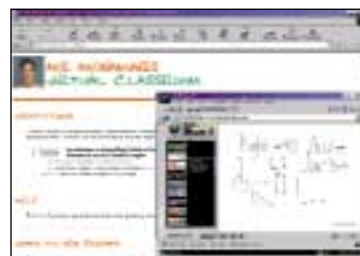
Tableau blanc ou tableau papier relié à mimio Windows®